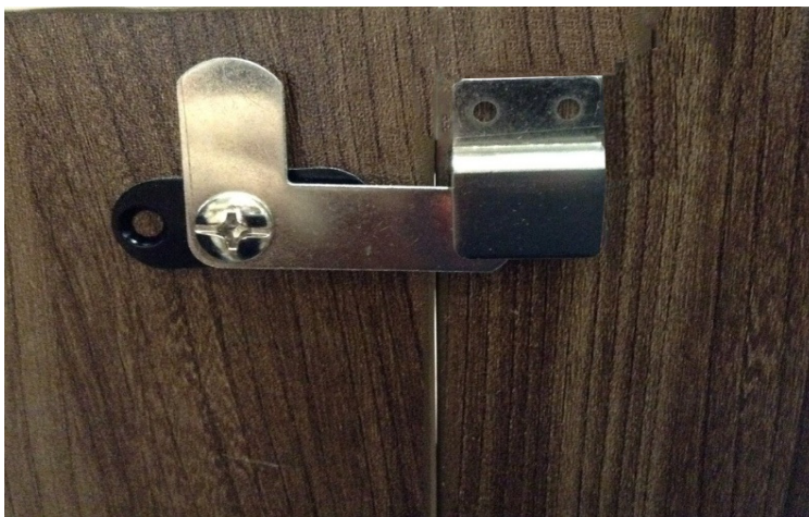
Τοποθέτηση κλειδαριάς βήμα 2/ Placement of lock step 2