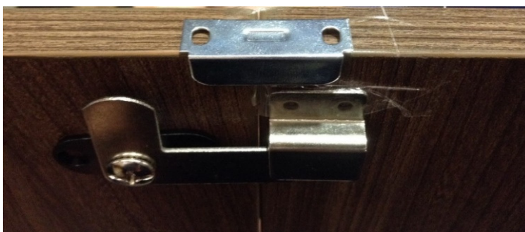
Τοποθέτηση κλειδαριάς βήμα 3/ Placement of lock step 3