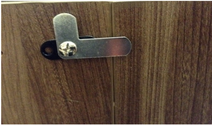
Τοποθέτηση κλειδαριάς βήμα 1/ Placement of lock step 1