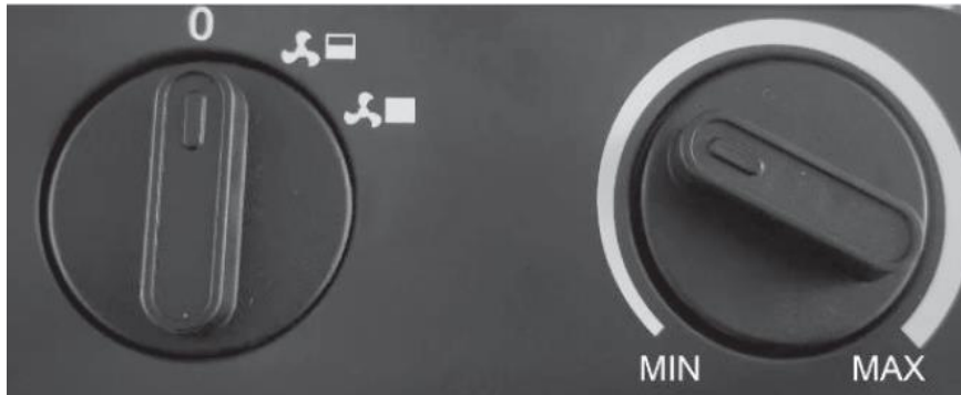
Εικόνα 1: Πίνακας Ελέγχου