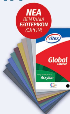
ΒΕΝΤΑΛΙΑ ΕΞΩΤΕΡΙΚΩΝ ΧΩΡΩΝ