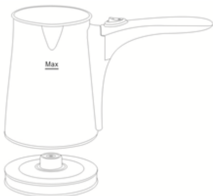
Εικ. 3 Βάλτε το δοχείο στη βάση. Ενεργοποιήστε.

,ανάλογα με το πόσα φλιτζάνια καφέ θέλετε να παρασκευάσετε (3 κούπες το μέγιστο).