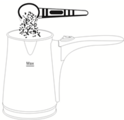
Εικ. 1 Βάλτε τον καφέ μέσα στο δοχείο