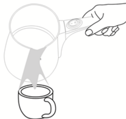
Εικ. 4 Απολαύστε τον καφέ σας.