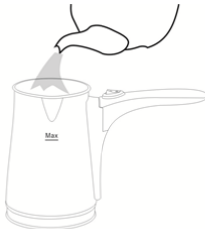
Εικ. 2 Εισάγετε νερό στο δοχείο

,ανάλογα με το πόσα φλιτζάνια καφέ θέλετε να παρασκευάσετε (3 κούπες το μέγιστο).