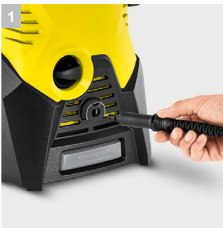
1 Quick Connect