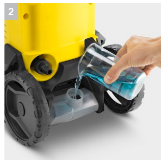
2 Διάλυμα καθαρού κάδου