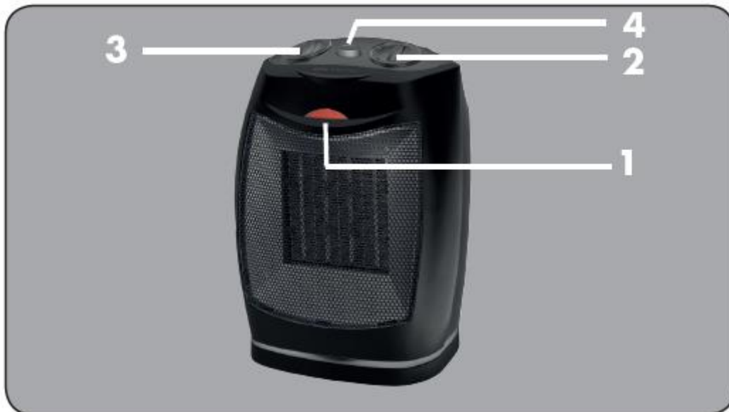
Εικ.1: Επισκόπηση συσκευής